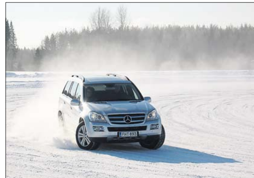
Huippunopeuksista tinkiminen pudottaa päästöjä.